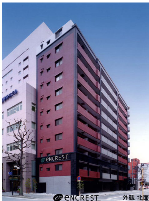
enCREST 外観 北面