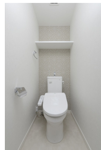
*室内写真が異なる場合は、現状を優先致します。