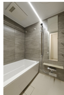
*室内写真が異なる場合は、現状を優先致します。