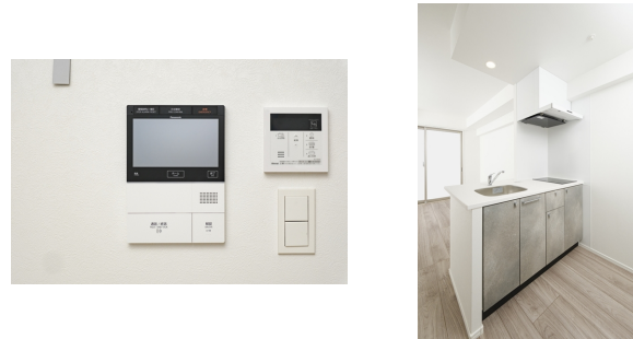
* 室内写真が異なる場合は、現状を優先致します。