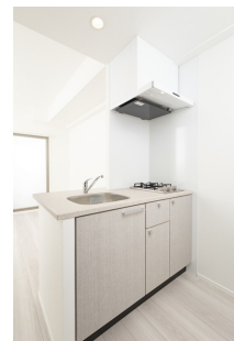
* 室内写真が異なる場合は、現状を優先致します。